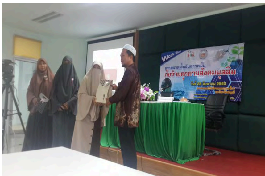
ภาพที่ 8 มอบของที่ระลึกให้ผู้ทรงคุณวุฒิ