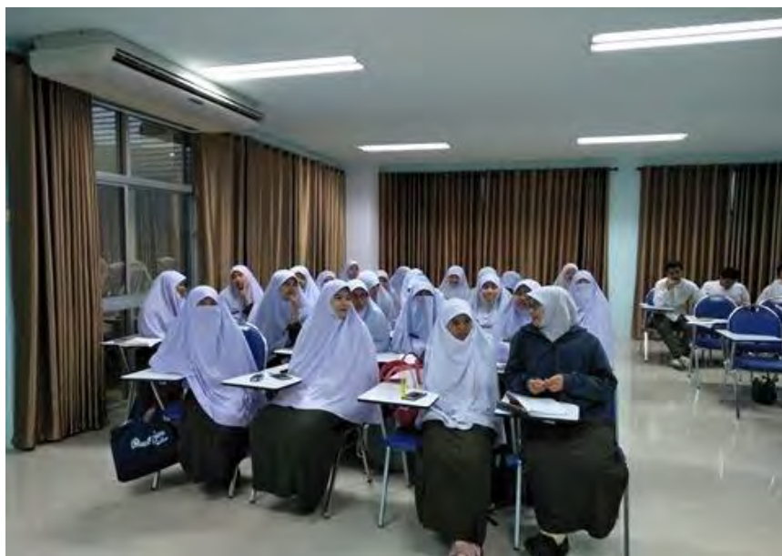
ภาพที่ 6 ผู้เข้าร่วมโครงการเสวนาและวิพากษ์งาน