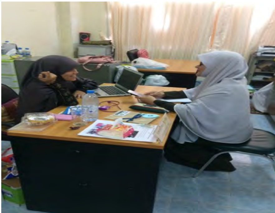
ภาพที่ 3 ลงพื้นที่สัมภาษณ์นักวิชาการ