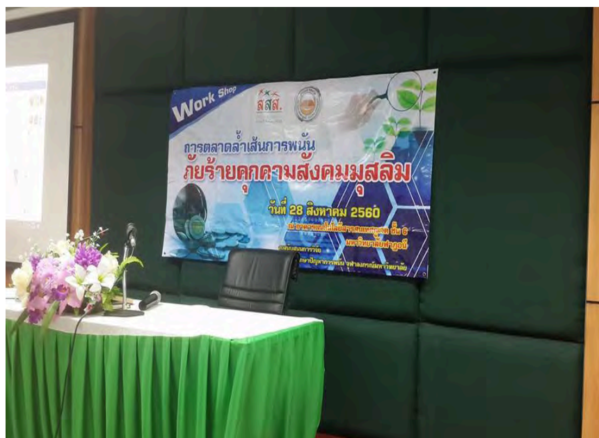
ภาพที่ 4 ฉากหลังโครงการเสวนาและวิทยากรงาน