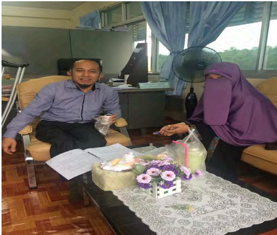
ภาพที่ 2 ประชุมร่วมกับที่ปรึกษาโครงการวิจัย