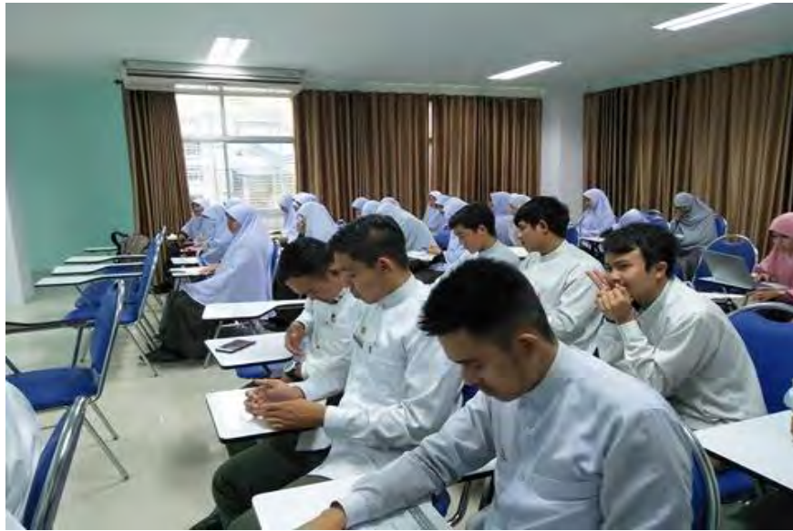
ภาพที่ 5 ผู้เข้าร่วมโครงการเสวนาและวิพากษ์งาน