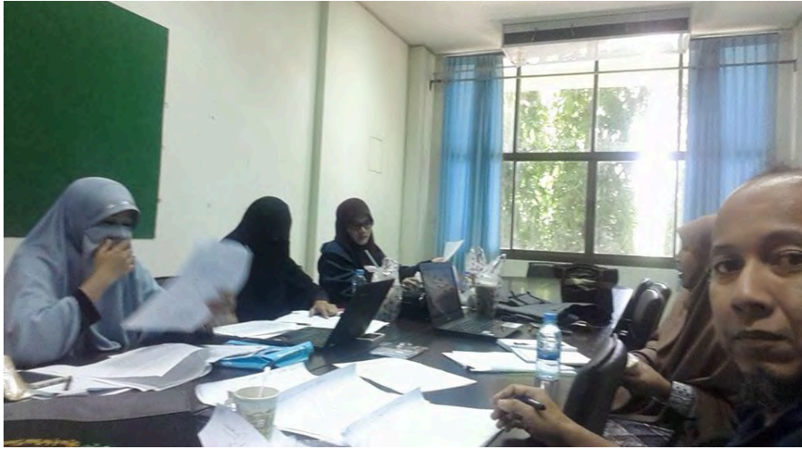
ภาพที่ 1 ประชุมทีมนักวิจัยเพื่อทำความเข้าใจในการทำงาน