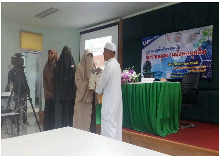
ภาพที่ 9 มอบของที่ระลึกให้ผู้ทรงคุณวุฒิ