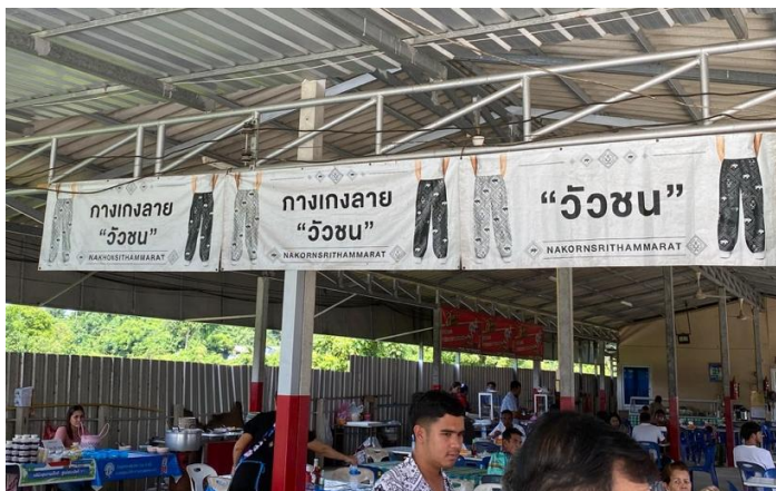
ภาพบรรยากาศภายในสนามในโซนของพื้นที่ขายของที่ผู้ชายของที่ระลึก