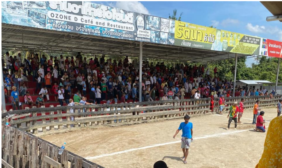
ภาพบรรยากาศในสนามวอลเลย์บอลแห่งหนึ่งโซนอัครินทร์ฝั่งซ้ายมือ

จากการสังเกตการณ์โดยภาพรวมนั้น พบว่า นักพนันมีทั้งคนวัยกลางคนและผู้สูงอายุเข้ามาเล่น และยังมีวัยรุ่นและผู้หญิงจำนวนหนึ่งเข้ามาในสนาม และเป็นที่น่าสนใจว่า มีเด็กเล็กตั้งแต่วัย 3 ขวบ จนถึง 10 กว่าปีเข้ามาสนามวอลเลย์บอล ซึ่งเด็กเล็กนั้นจะตามพ่อแม่เข้ามา ส่วนเด็กที่มีอายุในช่วง 10 กว่าปีมีที่นั่งอยู่รอบ ๆ สนามและเป็นทั้งเด็กเลี้ยงวัวที่เข้ามาดูแลวัวของตน